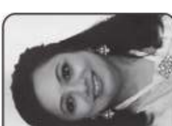
શ્રીમતી હેમલિન તરૂણ સત્રા ચિ. દિલ્લિ (ભયાઈ)